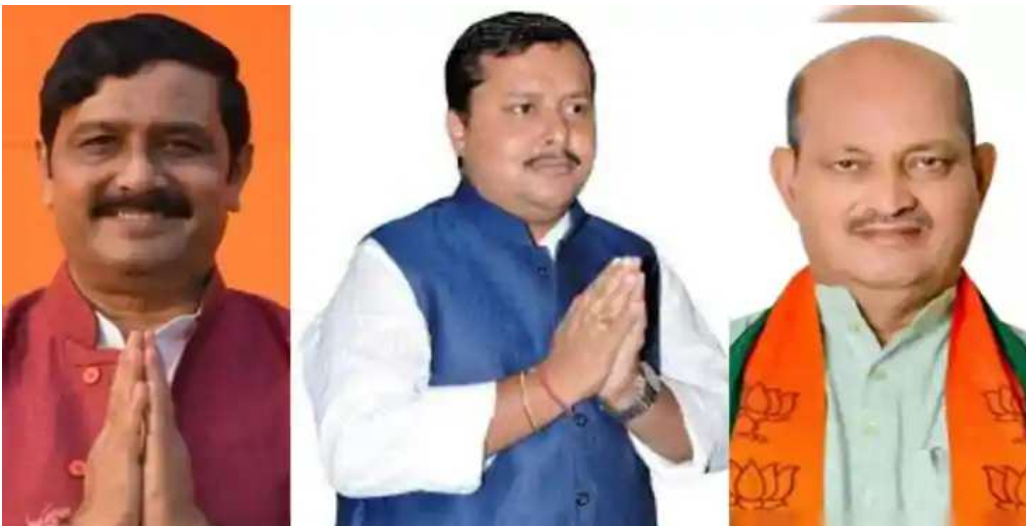
నితీష్ కీలక వ్యాఖ్యలు..

పాట్నా: బీహార్ రాజకీయాల్లో కొత్త శకం మొదలైంది. బీహార్ ముఖ్యమంత్రి నితీష్ కుమార్ సంచలన నిర్ణయం తీసుకున్నారు. ముఖ్యమంత్రి పదవి నుంచి తప్పుకోనున్నట్లు నితీష్ కుమార్ అధికారికంగా ప్రకటన చేశారు. తాను రాజ్యసభకు వెళ్తున్నట్లు క్లారిటీ ఇచ్చారు. ఈ నేపథ్యంలో తదుపరి బీహార్ ముఖ్యమంత్రి ఎవరు? అనే చర్చ మొదలైంది. అయితే, బీహార్ లో ఎన్డీయే కూటమి అధికారంలో ఉన్న కారణంగా బీజేపీ నుంచి ముఖ్యమంత్రి స్థానం దక్కించుకునే అవకాశం ఉన్నట్లు సమాచారం. ఈ మేరకు జాతీయ మీడియాలో ఇద్దరి పేర్లు చక్కర్లు కొడుతున్నాయి. బీహార్ కొత్త సీఎంగా సామ్రాట్ చౌదరి బాధ్యతలు చేపట్టవచ్చని తెలుస్తోంది. అలాగే, నిత్యానంద రాయ్ పేరు కూడా ప్రముఖంగా వినిపిస్తోంది. కాగా, అధికారికంగా ప్రకటన రావాల్సి ఉంది. ఇక, సామ్రాట్ చౌదరి బీహార్ రాజకీయాల్లో అంతర్భాగంగా ఉన్నారు. పంచాయతీరాజ్ మంత్రిగా ఉన్నప్పటి నుండి ప్రస్తుతం రాష్ట్ర హోంమంత్రిగా బాధ్యతలు నిర్వహిస్తున్న వరకు బీజేపీ నాయకుడిగా కీలక పదవులను నిర్వహించారు. ప్రస్తుతం ఉప ముఖ్యమంత్రిగా రెండవసారి బాధ్యతలు నిర్వహిస్తున్నారు. సీఎం రేను కోసం నిత్యానంద రాయ్ కూడా పోటీలో ఉన్నారు. రాయ్ ప్రస్తుతం హోంమంత్రిగా పనిచేస్తున్నారు. కేంద్రంలో పని చేయడానికి ముందు, రాయ్ బీహార్ కు బీజేపీ అధ్యక్షుడిగా పనిచేశారు. రాయ్ హాజీపూర్ నుండి నాలుగుసార్లు ఎమ్మెల్యేగా ఉన్నారు. 2015లో రాయ్ పార్లమెంటులో టికెట్ గెలుచుకుని ఉజయ్యారావు నుండి ఎంపీగా పనిచేశారు. మరోవైపు.. నితీష్ కుమారుడు నిశాంత్ దివ్యూటీ సీఎం అయ్యే అవకాశం ఉందని తెలుస్తోంది.