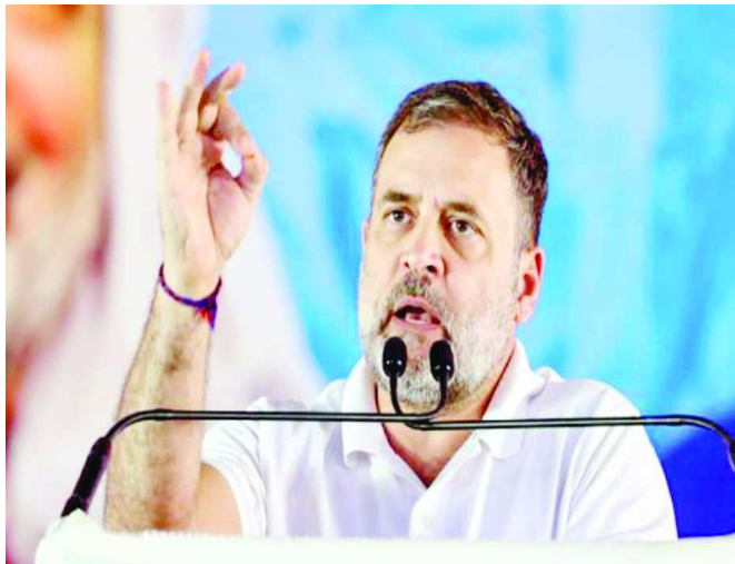
మండిపడ్డారు. ఇరాన్ సుప్రీం లీడర్ ఖమేనేని అమెరికా హత్య చేసిన ఘటనపై స్పందించిన మోదీ, ఇరాన్ యుద్ధ నౌక ఘటనపై మాట్లాడకపోవడంలో పెద్ద విదూరమేం లేదన్నారు.

పశ్చిమాసియా సైనిక ఘర్షణ చివరకు భారత్ పొరుగుదేశం దాకా చేరుకుందని, అయినా ప్రధాని మోదీ మౌనంగా ఉండటాన్ని కాంగ్రెస్ అగ్రనేత రాహుల్ గాంధీ తప్పుపట్టారు. శ్రీలంక సమీపంలోని హిందూ మహాసముద్రంలో ఇరాన్ కు చెందిన ఐఆర్ఐఎస్ దేనా యుద్ధనౌకను అమెరికా జలాంతరామి ముంచేసినా మోదీ మాట్లాడకపోవడం సరికాదన్నారు. ఈమేరకు గురువారం ఆయన ఒక ట్వీట్ చేశారు. ఈ క్షిప్ర పరిస్థితుల్లో మన దేశం తరఫున డైరెక్ట్ గా నిలువగగ్గే, మాట్లాడగలిగే నాయకుడు కావాలని రాహుల్ పేర్కొన్నారు. కానీ భారతదేశ వ్యూహాత్మక స్వతంత్రతను ప్రధాని మోదీ ఇతర దేశాలకు సరెండర్ చేసి రాజకీయ వచ్చారని మండిపడ్డారు. ఇరాన్ నౌకను అమెరికా ముంచేసిన అంశంపై ఇప్పటిదాకా భారత ప్రధాని ఒక్కమాట కూడా మాట్లాడలేదన్నారు. గల్ఫ్ ప్రాంతంలో జరుగుతున్న సైనిక ఘర్షణ వల్ల భారత్ కు జరిగే ముడి చమురు సరఫరా ముప్పు ఉంటుందని ఆయన పేర్కొన్నారు. భారత్ వినియోగించే ముడి చమురులో 40 శాతానికిపైగా ఇరాన్ కు చెందిన హార్ట్ లెస్ జలసంధి మీదుగానే వస్తుంటుందని గుర్తుచేశారు. ఈ పరిణామాల ముడి చమురు, సహజ వాయువు విభాగాలపై ప్రతికూల ప్రభావాన్ని చూపుతాయని రాహుల్ హెచ్చరించారు. ప్రస్తుతం యావత్ ప్రపంచం అనిశ్చితిలో ఉందని, రాబోయేది కష్టకాలమని ఆయన వ్యాఖ్యానించారు.