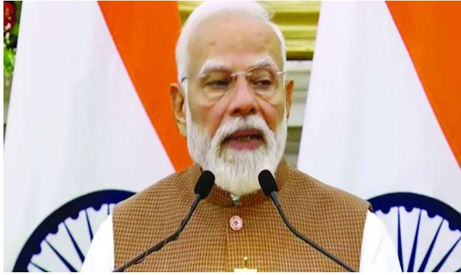
గ్రీన్ టెక్నాలజీ రంగంలో సహకారానికి నిదర్శనాలంటూ!

ప్రపంచవ్యాప్తంగా కొనసాగుతున్న యుద్ధాలు, భద్రతా ఉద్రిక్తతల నేపథ్యంలో శాంతి, సంభాషణల ద్వారానే సమస్యలకు పరిష్కారం సాధ్యమని ప్రధానమంత్రి సరేంద్ర మోదీ స్పష్టం చేశారు. ఉక్రెయిన్ నుంచి పశ్చిమాసియా వరకు అనేక ప్రాంతాల్లో యుద్ధ మేఘాలు కమ్ముకున్నాయని, సైనిక చర్యలకన్నా చర్చలు, రాజనీతి శాశ్వత పరిష్కారమని అన్నారు. దిల్లీలోని హైదరాబాద్ హోటల్ గురువారం ఫిన్ల్యాండ్ అధ్యక్షుడు అలెగ్జాండర్ స్టేబ్తో కలిసి నిర్వహించిన సందాయక మీడియా సమావేశంలో మోదీ ఈ వ్యాఖ్యలు చేశారు. "ప్రస్తుతం ప్రపంచం అస్థిరత, అనిశ్చితి దశలో ఉంది. ఉక్రెయిన్ నుంచి పశ్చిమాసియా వరకు అనేక ప్రాంతాల్లో ఘర్షణలు కొనసాగుతున్నాయి. చట్టపరమైన వ్యవస్థ, సంభాషణ, రాజనీతిపై భారత్, ఫిన్ల్యాండ్ సమ్మతం ఉంచుతున్నాయి" అని తెలిపారు.